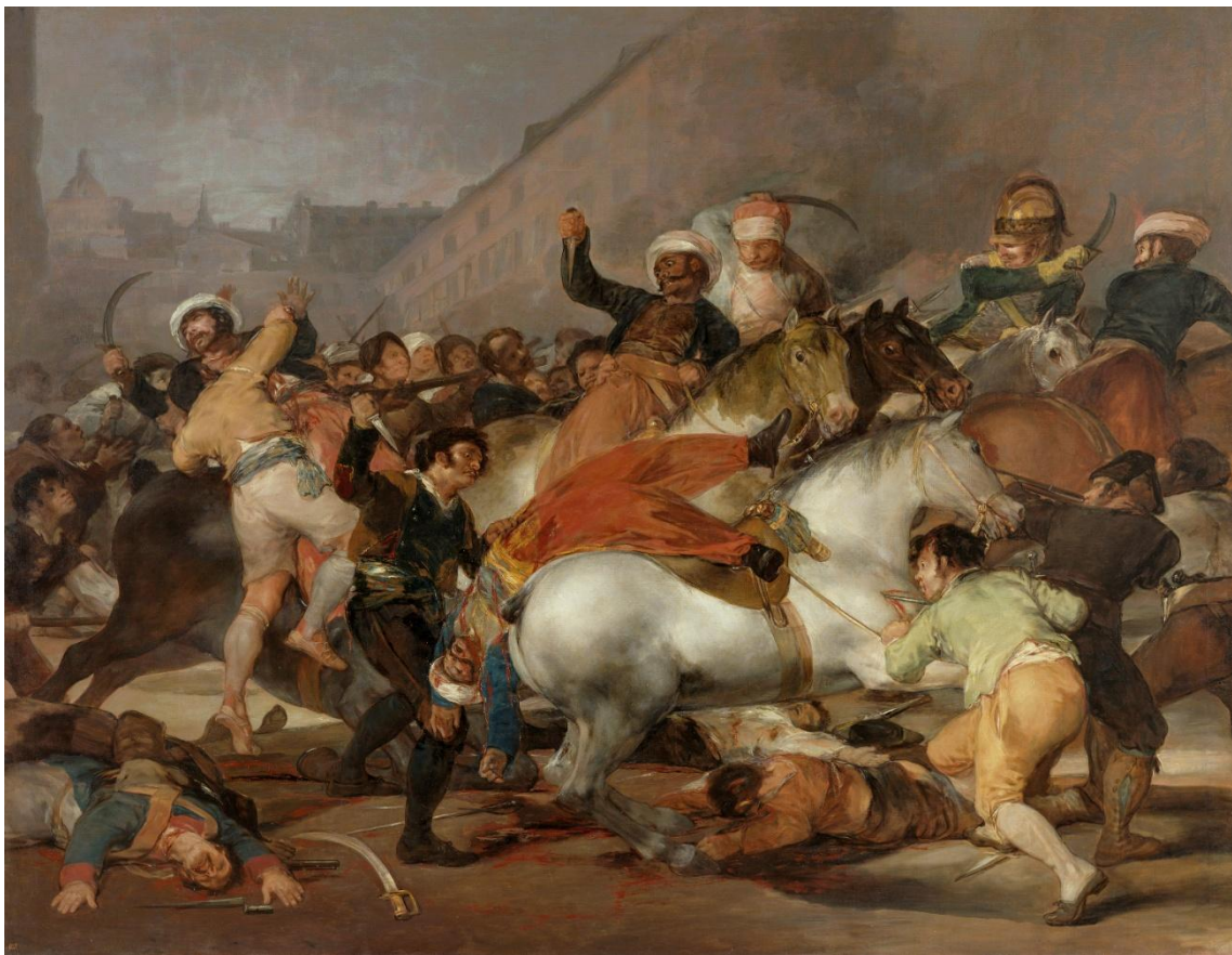
Dos de Mayo